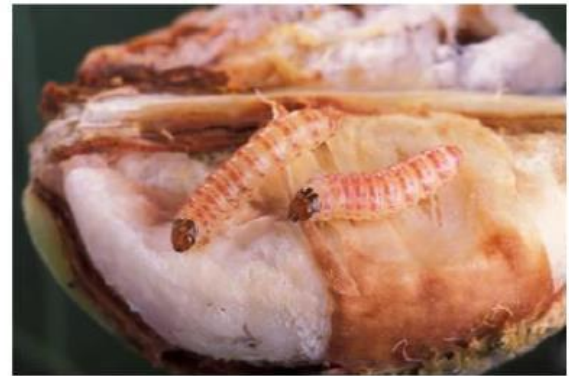
કપાસમાં ગુલાબી ઈયળનું નુકસાન